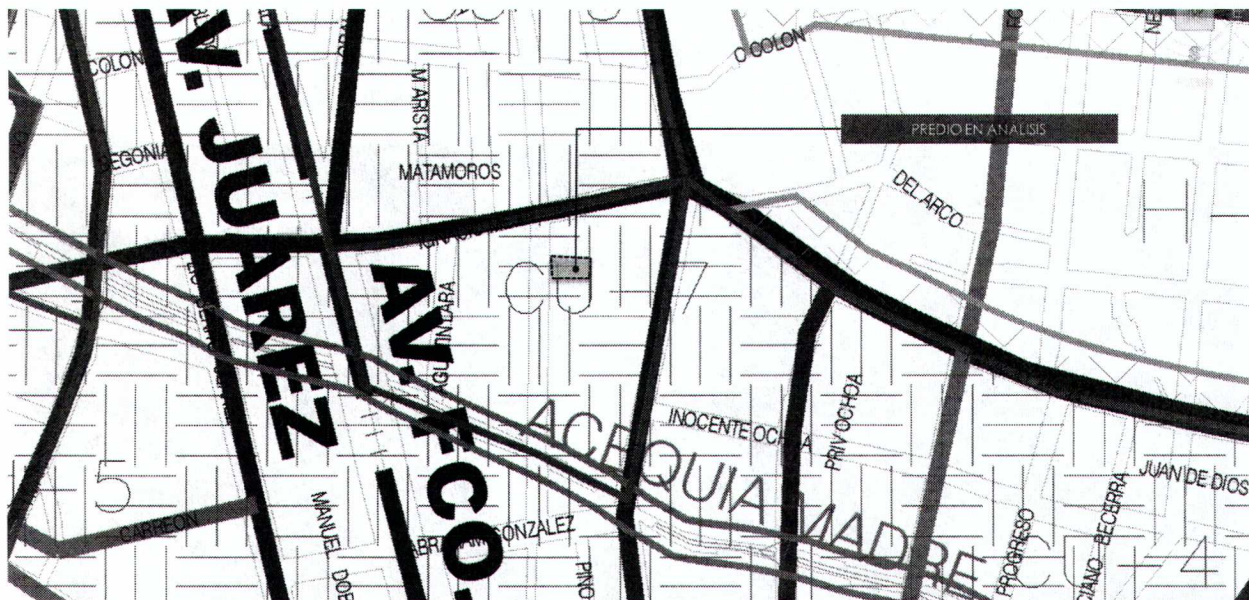
Figura 2. Carta Urbana, PDUS 2016.

QUINTO. La Carta Urbana del PDUS establece que el predio se encuentra dentro de la zonificación secundaria CU-7: Centro Urbano. (Ver figura 2)