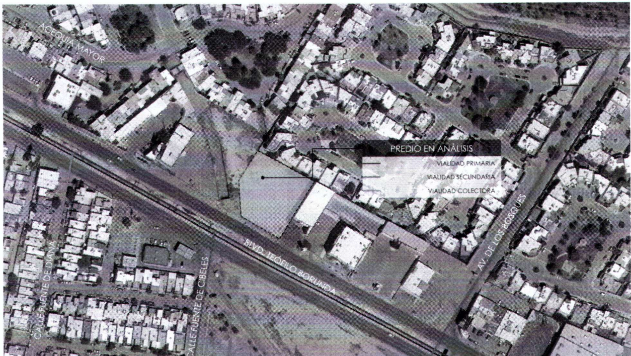
Figura 1. Ubicación del predio en estudio.

Vistos para resolver respecto solicitud de una Modificación Menor al Plan de Desarrollo Urbano Sostenible para el Centro de Población de Ciudad Juárez Chihuahua 2016 (PDUS) presentada ante esta Comisión que consiste en un cambio de zonificación secundaria de un predio con una zonificación H-40: Habitacional 40 viv/ha a una zonificación SH-4/60: Servicios y Habitacional ubicado en el Blvd. Teófilo Borunda número 7671 de la colonia Partido Iglesias de esta ciudad, que cuenta con una superficie total de 2,759.29 m 2 . (Ver figura 1)