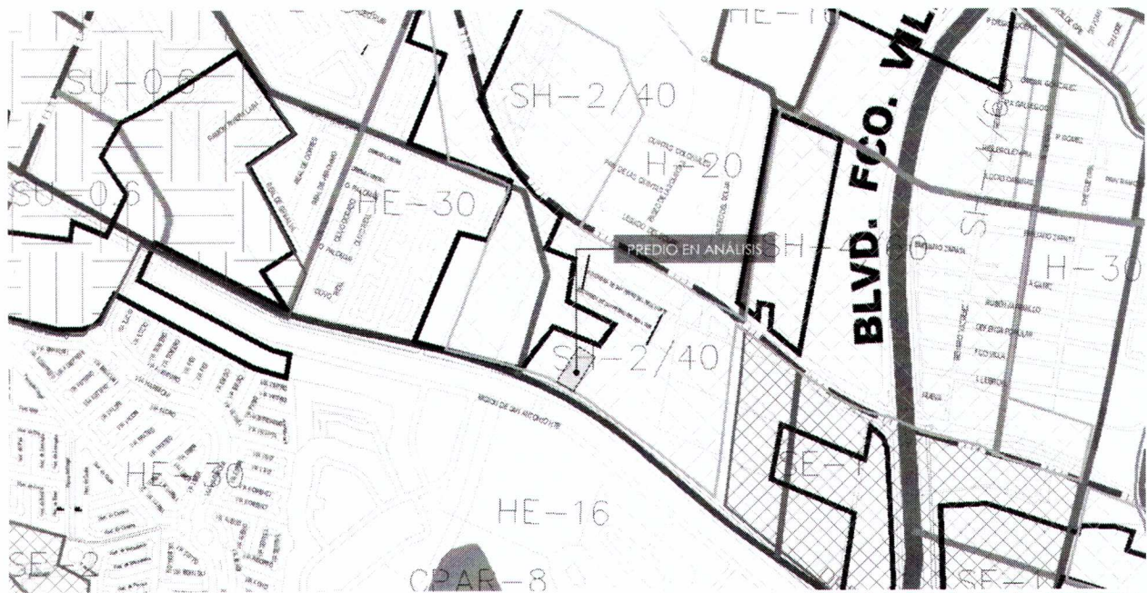
Figura 2. Estrategia vial, PDUS 2016.

CUARTO. La Carta Urbana del PDUS establece que el polígono se encuentra dentro de la zonificación secundaria SH-2/40: Servicios y Habitacional . (Ver figura 2)